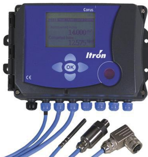
Рисунок 1 – Общий вид корректора

Фотография общего вида корректора представлена на рисунке 1.