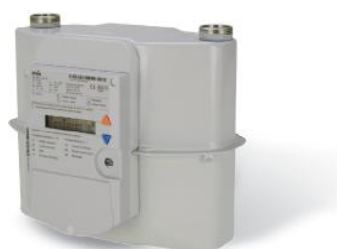
G4-RF1 sV G, G6-RF1 sV G

Внешний вид счетчиков газа диафрагменных G4-RF1 sV G, G6-RF1 sV G, GALLUS sV G показан на рисунке 1.