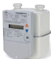
GALLUS sV G