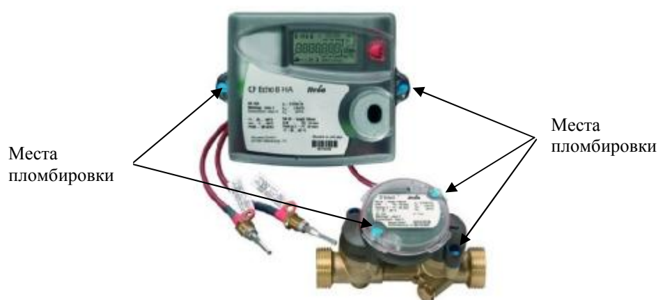
Рис. 3 - Места пломбировки теплосчетчиков CF, модели CF 51/55/Echo II