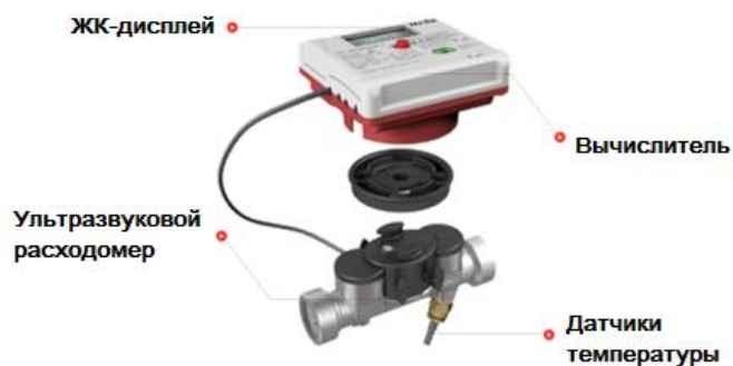
Рис. 1 – Основные части теплосчетчика типа CF (модель CF-UltraMaXX V)

Степень защиты составных частей теплосчетчиков от проникновения пыли и влаги не ниже IP54 по ГОСТ 14254-96.