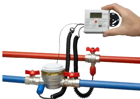
Рис. 2 – Пример установки теплосчетчика типа CF (модель CF-UltraMaXX МК)