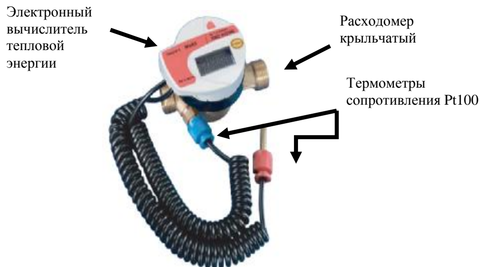
Рис. 1 – Внешний вид теплосчетчика Integral MaXX

Прямые участки обеспечиваются монтажными комплектами, которые поставляются вместе со теплосчетчиками. Счетчик может быть установлен на горизонтальном или вертикальном участке трубопровода прямого или обратного трубопровода системы теплоснабжения