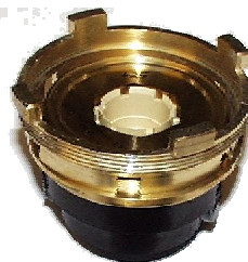
Рис. 3 – Гидравлическая часть теплосчетчика Integral-MK MaXX