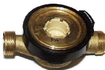
Рис. 2 – Гидравлическая часть теплосчетчика Integral-V MaXX